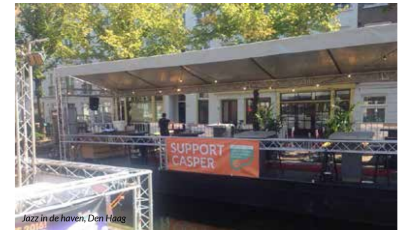
Jazz in de haven, Den Haag

“De eerste prioriteit is het werven van gelden en het zo snel mogelijk ter beschikking stellen van innovatief onderzoek.”