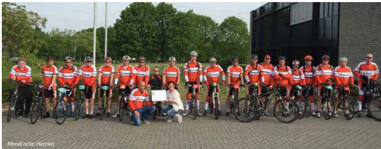
Mondi actie, Heerlen