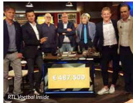
RTL Voetbal Inside