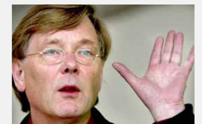
Ab Osterhaus - Lid