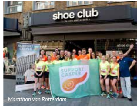
Marathon van Rotterdam