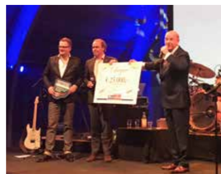
Benefietconcert, Nieuwe Luxor Theater in Rotterdam